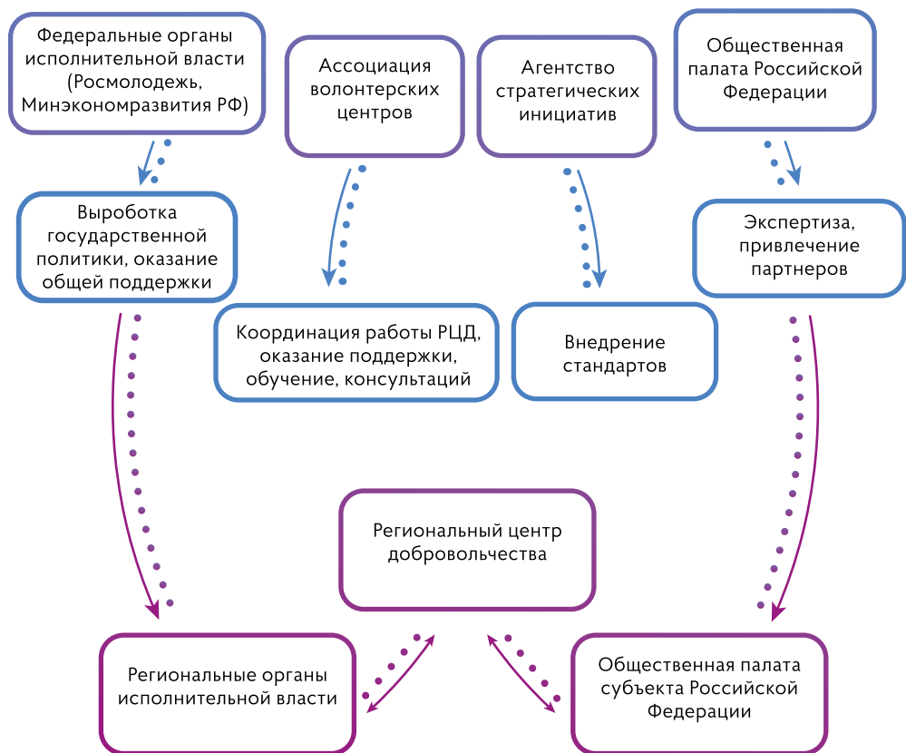
Рисунок 2 – Структура взаимодействия ресурсного центра добровольчества